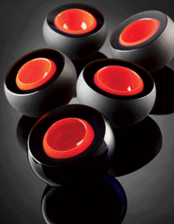
Вазы CAJA CAJA из коллекции BASICS, ANNA TORFS

Весну в пустыне воплотила немецкая компания в скульптурных фарфоровых объектах. Они расписаны вручную и глазурованы с помощью особой технологии. В коллекцию Cactus входят три вида ваз, подсвечник, тарелка для конфет и флакон для духов.