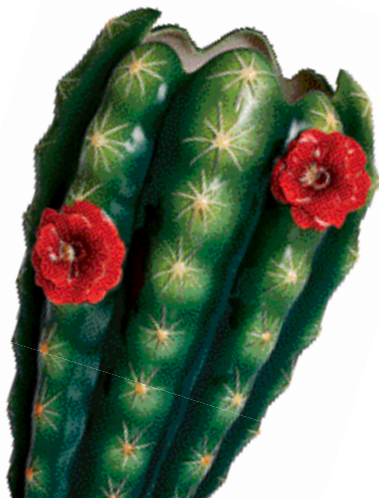
Ваза WILD WONDER из коллекции CACTUS, дизайнер Kuang-Yuh Lee, FRANZ COLLECTION

Весну в пустыне воплотила немецкая компания в скульптурных фарфоровых объектах. Они расписаны вручную и глазурованы с помощью особой технологии. В коллекцию Cactus входят три вида ваз, подсвечник, тарелка для конфет и флакон для духов.